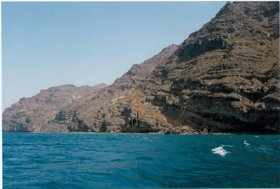
Fotografía 6.- Apilamiento de coladas basálticas, del tramo medio de la Fase miocena, - con un depósito piroclástico oxidado intercalado (P), atravesadas por di ques basálticos, en el acantilado del Cuchillo de la Entallada. MIOCENO