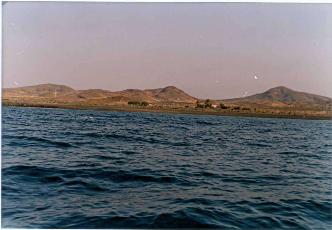
Fotografía 2.- Vista general de los relieves del tramo inferior de la Fase miocena en el área de la desembocadura del barranco Arroyo-Angurri, junto a Las Playitas. MIOCENO