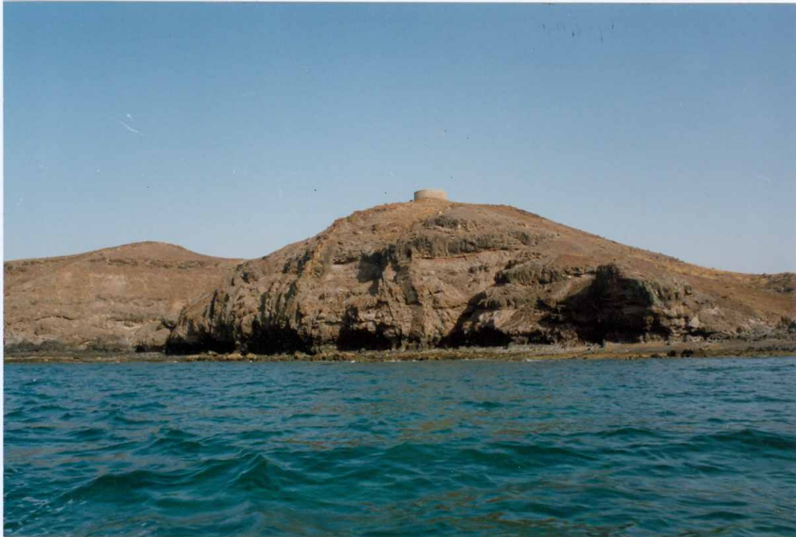
Fotografía 3.- Apilamiento de coladas basálticas del tramo inferior de la Fase miocena, en la Montañeta del Cuevón, junto a Las Playitas. Atravesando las coladas se observan numerosos diques basálticos verticales, de dirección - N120°E. MIOCENO