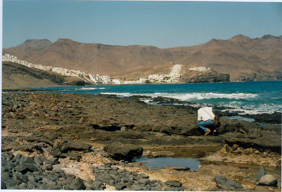
Fotografía 13.- Rasa marina jandiense (Pleistoceno superior), + 1 m de altura sobre el nivel del mar, en las inmediaciones de Las Playitas. HOLOCENO