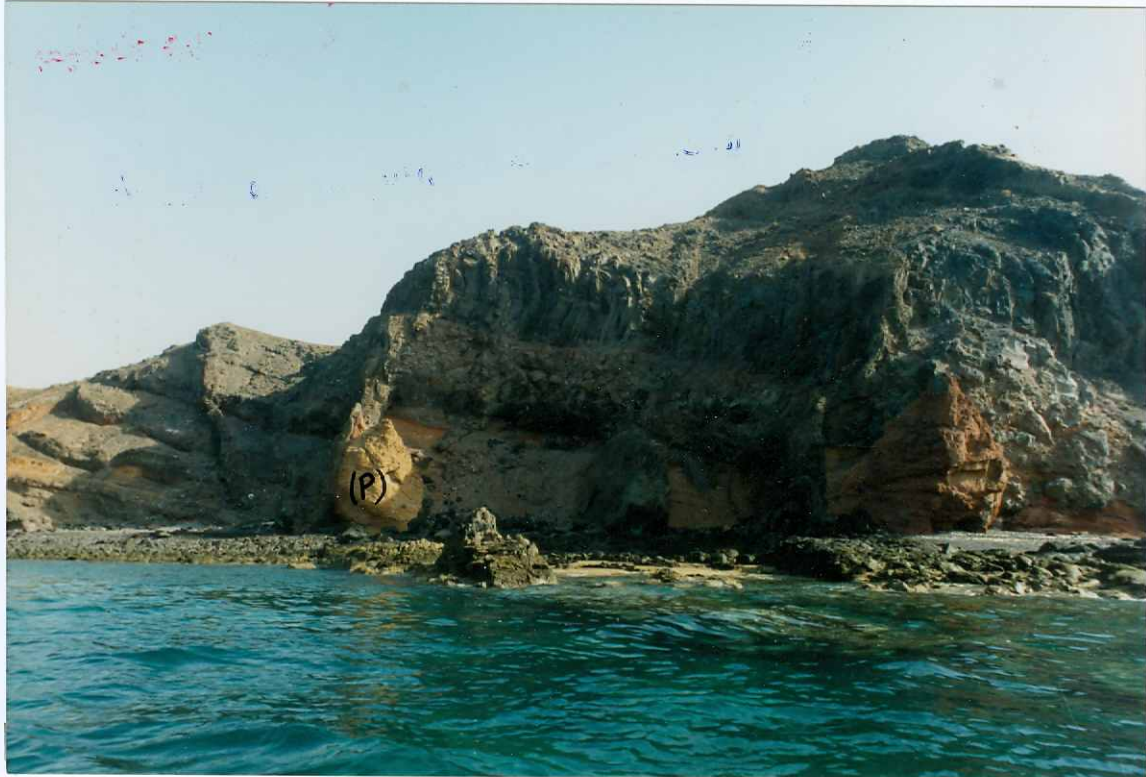
Fotografía 4.- Depósitos sedimentarios aluviales intercalados entre un edificio piroclástico (P) y coladas basálticas del tramo medio de la Fase miocena, en el acantilado del Cuchillo de la Entallada (Las Goteras). MIOCENO