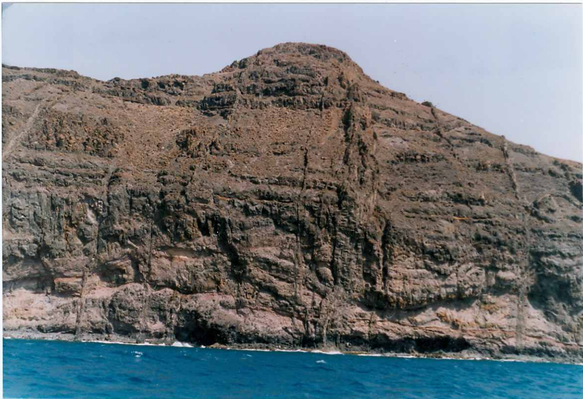
Fotografía 7.- Apilamiento de coladas basálticas del tramo medio de la fase miocena, atravesadas por abundantes diques, en el acantilado del Cuchillo de la Entallada. MIOCENO