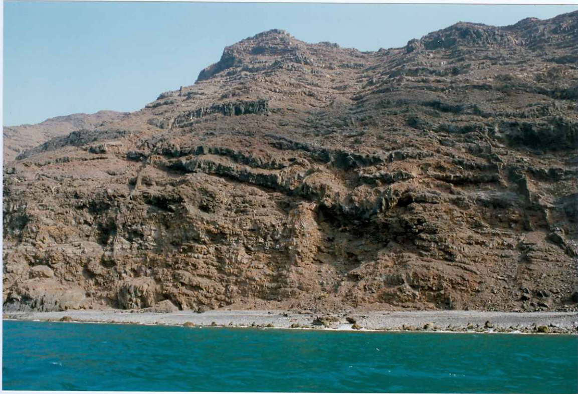
Fotografía 9.- Apilamiento de coladas basálticas del tramo medio, de la Fase miocena, atravesadas por diques, en el acantilado del Cuchillo de la Entallada. MIOCENO