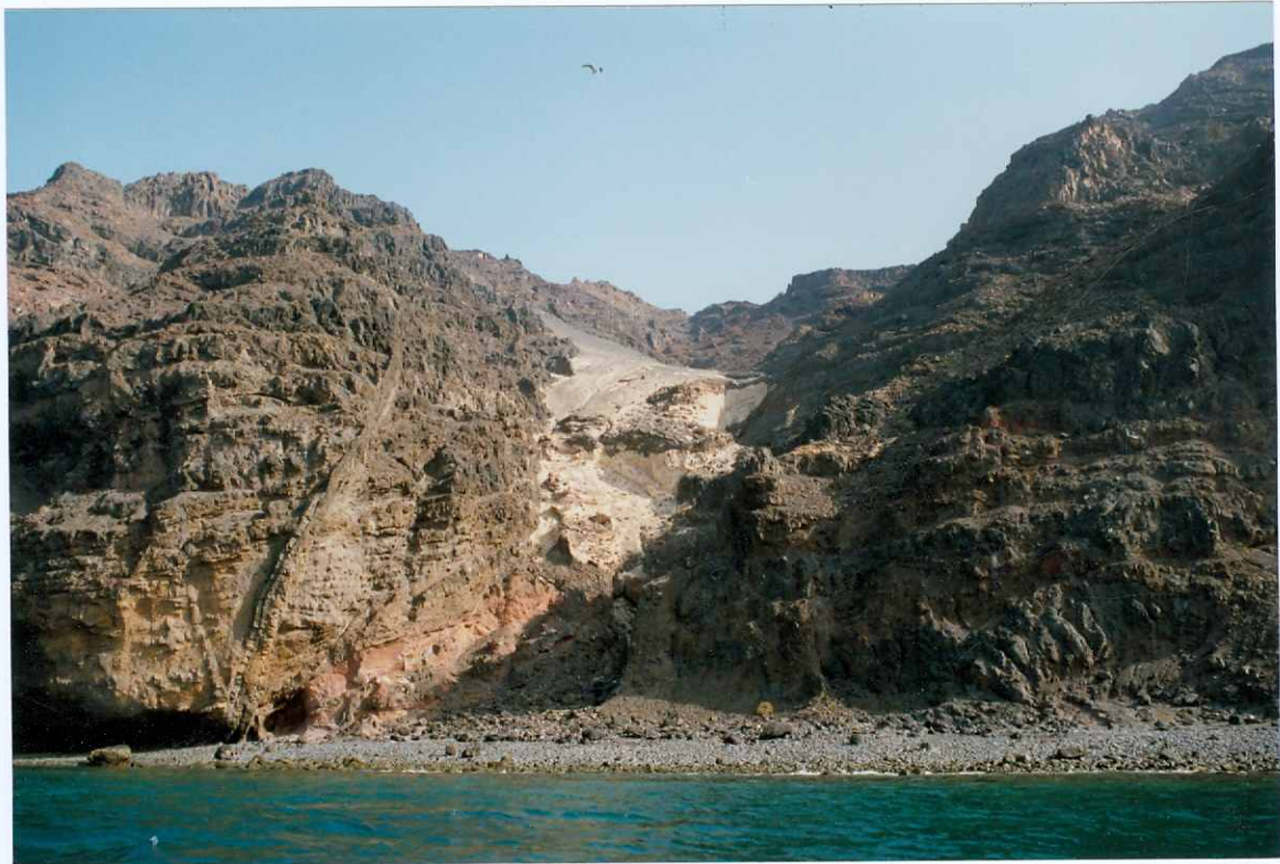
Fotografía 5.- Depósitos de arenas eólicas (pleistocenas) sobre un apilamiento de coladas basálticas del tramo medio de la Fase miocena atravesadas por diques, en la zona de El Jablito, Cuchillo de la Entallada. MIOCENO