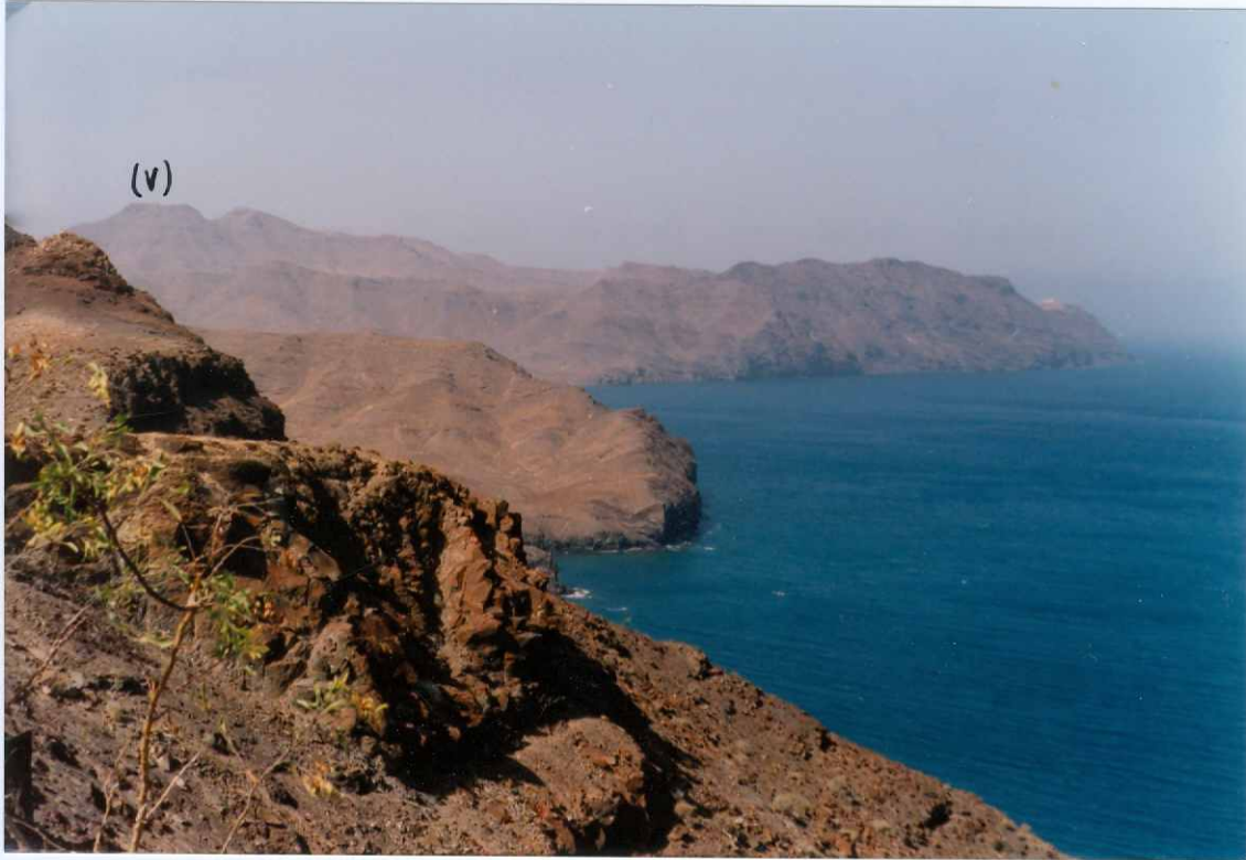
Fotografía 1.- Vista general de la costa, desde el faro de Gran Tarajal hasta el faro de la Entallada (E). Al fondo a la izquierda está el pico de Vigán (V). MIOCENO