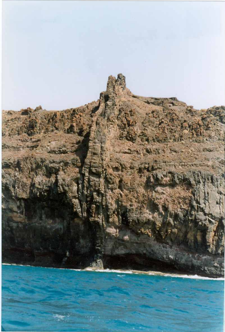
Fotografía 8.- Coladas basálticas del tramo inferior de la Fase miocena, atravesadas por varios diques, que siguen la misma vía de penetración. MIOCENO