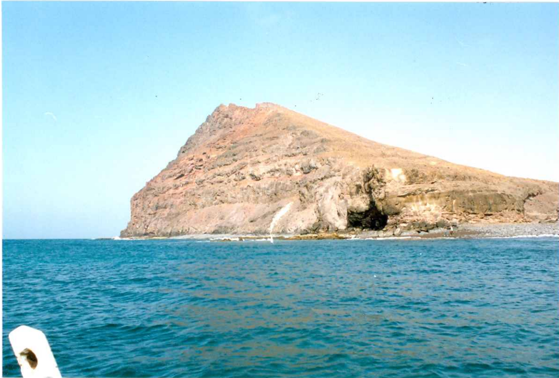
Fotografía 11.- Apilamiento de coladas basálticas del tramo medio, de la Fase miocena, en el acantilado de la Entallada. MIOCENO