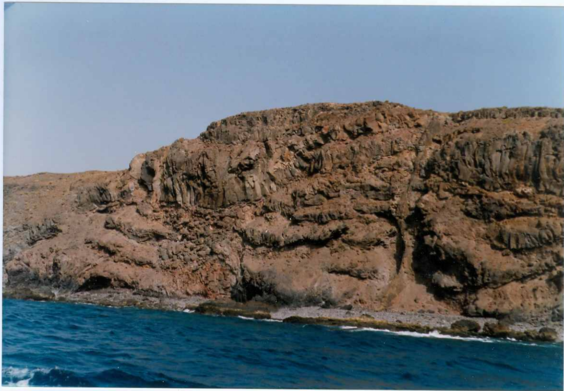
Fotografía 12.- Apilamiento de coladas basálticas de la fase miocena. Obsérvese el mayor espesor de las coladas superiores y su adaptación a las inferiores. Entre ambos tipos de coladas existe un pequeño depósito aluvial grosero. MIOCENO