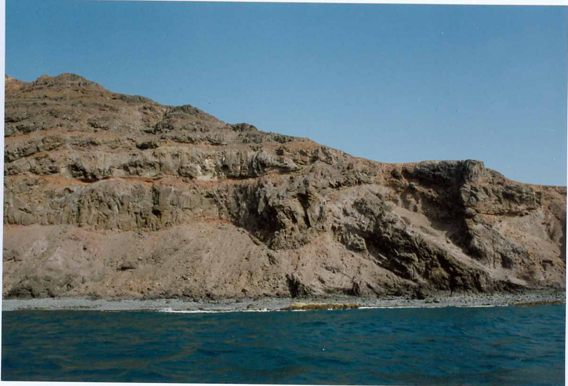
Fotografía 10.- Apilamiento de coladas basálticas del tramo medio de la Fase miocena, en la zona de Punta de la Entallada. Algunas coladas se adaptan a las que tienen debajo. MIOCENO